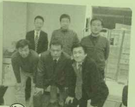
12/7 北高同窓会打合せ