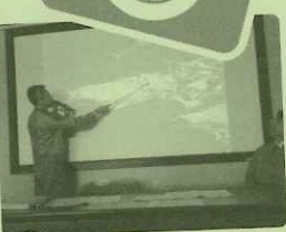
12/5 玄海原子力発電所視察