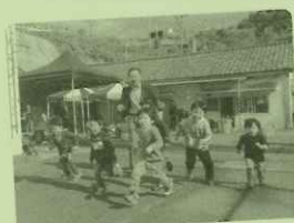
12/14 九電ユニオン家族行事

回答 利用率の低い大型車用の駐車場については、地元の意見を踏まえながら、有効活用策について早急に検討したい。