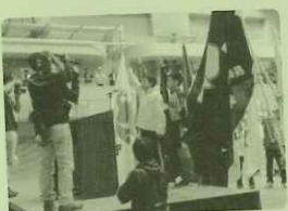
11/9 長崎県スポーツ祭