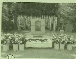
11/1 山里小学校平和祈念式典