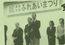
11/3 茂木ふれあいまつり