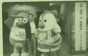
10/31 農地・水・環境保全フォーラム