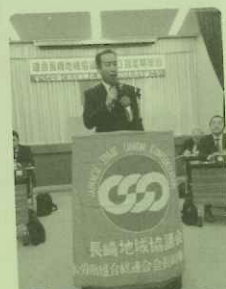
11/1 連合長崎地協大会