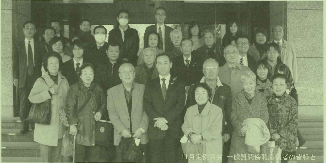
11月定例会 一般質問傍聴応募者の皆様と